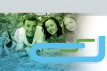
Tableau de garanties